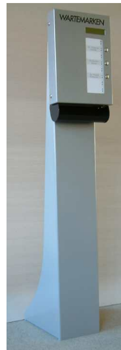
Standsäule ST 962 mit WM 963