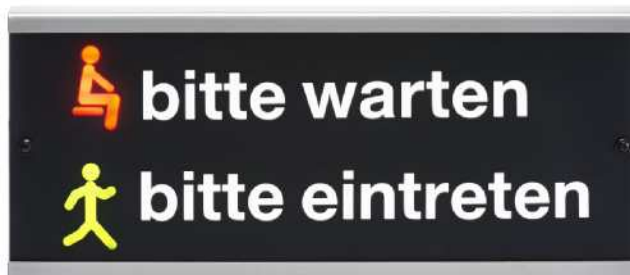
Beispiel: AT 302P mit LED-Pictogrammen