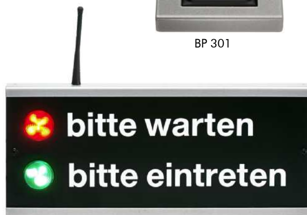
Beispiel: AT 302F mit LED-Leuchten und Funkempfänger