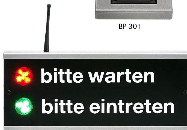
Beispiel: AT 302F mit LED-Leuchten und Funkempfänger