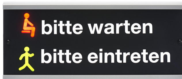
Beispiel: AT 302P mit LED-Pictogrammen