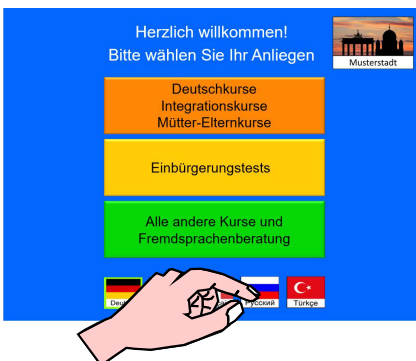
Auswahl der gewünschten Sprache