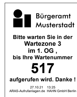
Ausgabe der zugehörigen Wartemarke