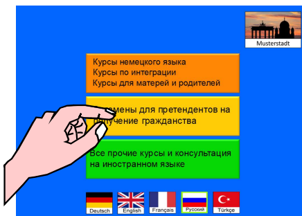
Auswahl des gewünschten Bereiches