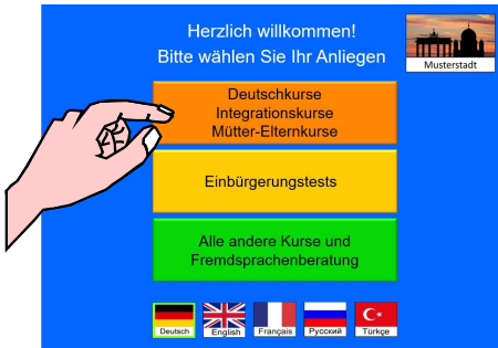
Auswahl des gewünschten Bereiches