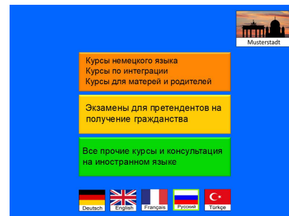
Anzeige der Seite in der gewählten Sprache